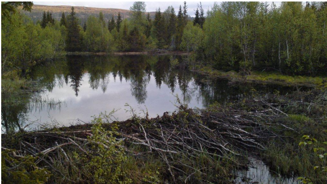
Beveren er en aktiv arbeidskar på Luruholman i Lurudalen.

Gaupespor registreres jevnlig og den er svært aktiv i områdene. Mye rein tas av gaupa. Jervregistreringsarbeidet avdekket ingen ynglinger i nasjonalparkene, men det ble observert til tider stor aktivitet av både tisper og hannjerv.