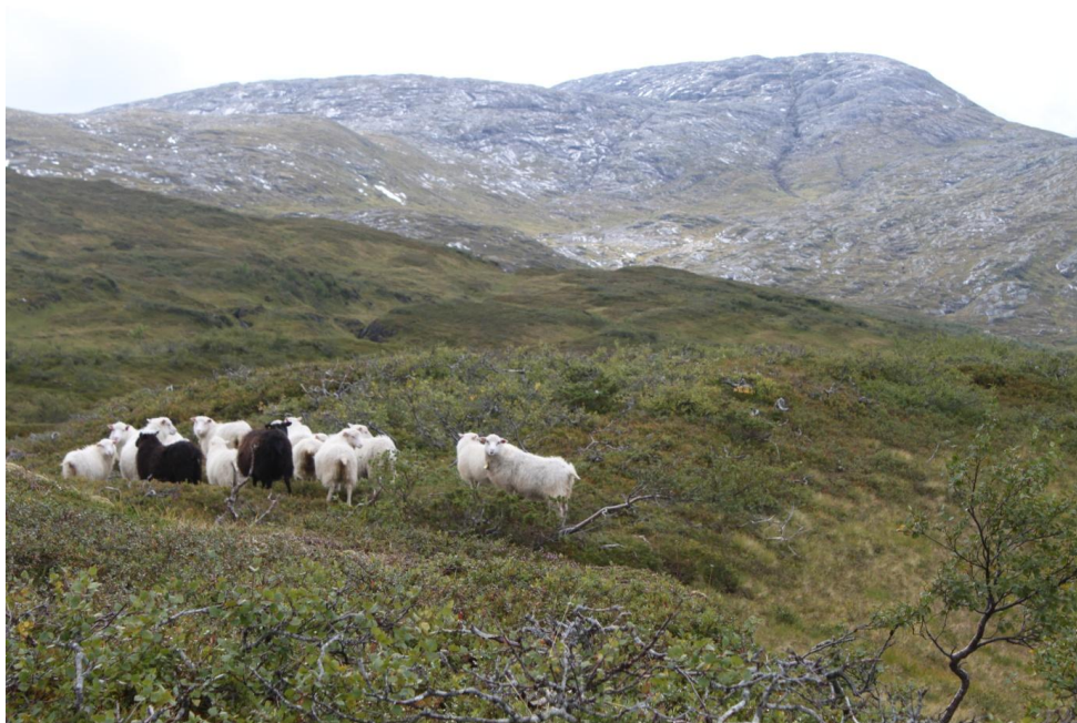
Sau på beite i Skjækra nord for Skjækerhatten

Det foregår reinbeite i alle statsallmenningene i Snåsa. Reinbeitedistriktene som har areal som også omfatter statsallmenningene på Snåsa er Låarte sijte, Skæhkere sijte og Østre Namdal reinbeitedistrikt.