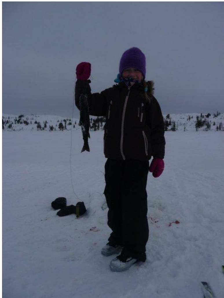
Nå kan alle under 20 år fiske gratis med stang og krok på statsallmenningen