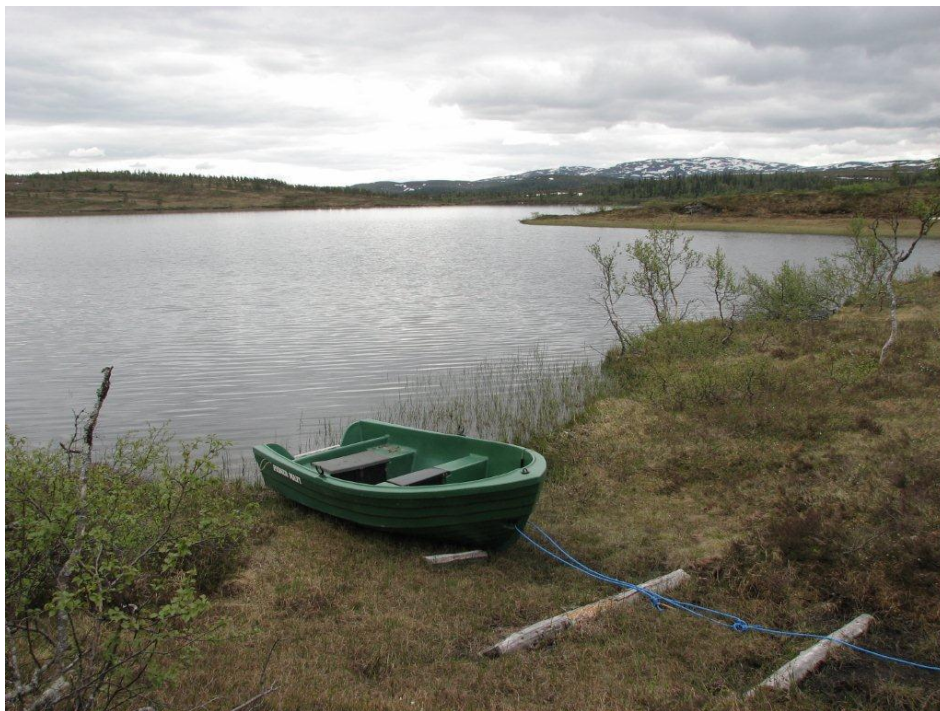
Fjellstyrets utleiebåt ved Ismenningen

Ved opprettelsen av Blåfjella-Skjækerfjella nasjonalpark kom det en verneforskrift som gav en del konsekvenser for bruken og utnyttelsen av disse fjellområdene. Blant annet ble det lagt strenge føringer på utlegging av båter. For å håndtere alle spørsmål om båttopplag i statsallmenningen, både i og utenfor nasjonalparken, har fjellstyre sammen med Statskog arbeidet med en båtplan for statsallmenningene. Båtplanen har vært på høring og vil bli vedtatt i 2011.