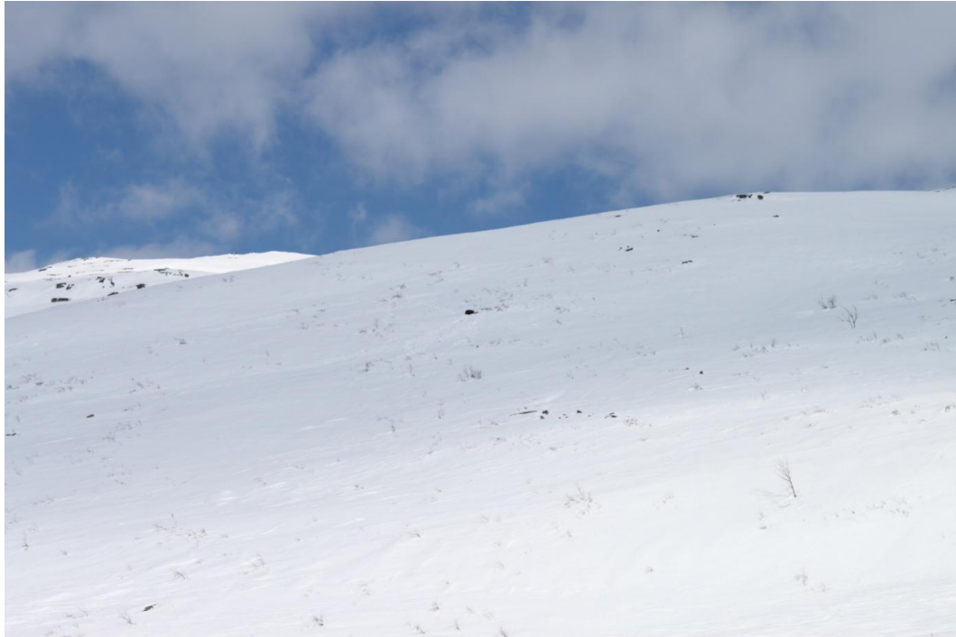
Bjørnen ligger ved hiåpningen, og vises som en svart prikk midt på bildet

Gaupespor registreres jevnlig og den er svært aktiv i områdene. Mye rein tas av gaupa. Jervregistreringsarbeidet avdekket ingen ynglinger i nasjonalparkene, men det ble observert til tider stor aktivitet av både tisper og hannjerv.