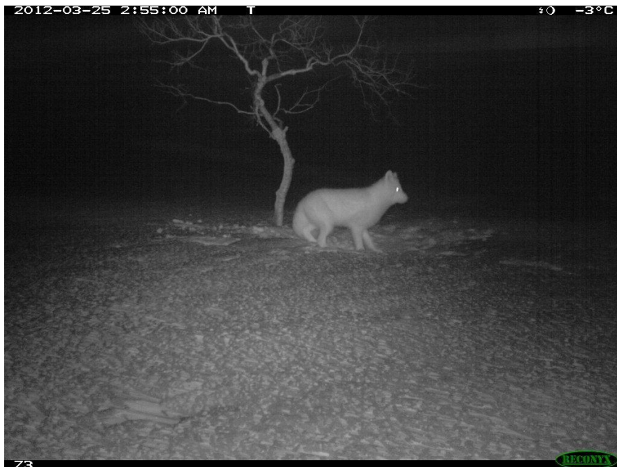
Her har fjellreven dukket opp på et viltkamera i Aksselfjella

Fjellreven dukket opp igjen i Snåsafjella i 2012. Etter at den har lenge har vært borte fra disse fjellområdene ble den plutselig observert flere steder både i Skjækerfjella og øst i Snåsafjella. Gjennom det norsk-svenske prosjektet «Felles fjellrev» er det satt ut viltkamera ved åteblokker i fjellet for og om mulig kunne dokumentere fjellrev. Det dukket opp flere fjellrever på flere kamera! Sannsynligvis er disse innvandret fra Børgefjell eller fra områder i Sverige sør for oss.