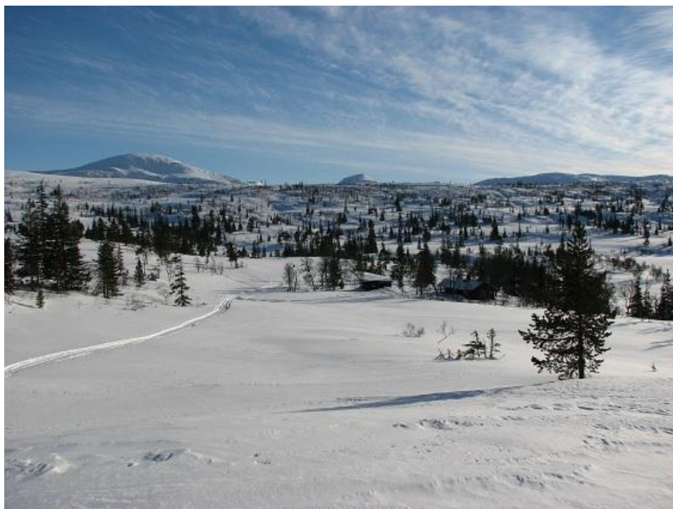
Bruken av fjellstyrehyttene er økende, og mest brukt er Nåvasshytta i Skjækra

I 2012 ligger andelen online bookinger på hyttene gjennom inatur.no på 90 %. Antall sidevisninger på inatur.no har økt fra 5 400 i 2011 til 8 000 i 2012.