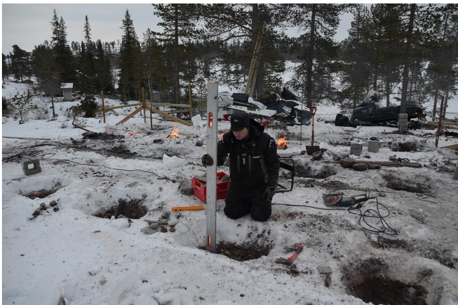
Forberedende arbeid til ny fjellstyrehytte ved Andorsjøen

Fjellstyret har tidligere fått omdisponert det gamle damhuset ved Andorsjøen til utleiehytte, og senere fått godkjent oppsetting av ny hytte i stedet for den gamle som var i dårlig forfatning. Fjellstyret har nedsatt en byggekomite som har innhentet pristilbud fra lokale byggfirma på oppsetting av ny hytte, og har valgt Jan Åge Øien AS som leverandør av hytte. Hytta blir oppsatt i løpet av 2013.