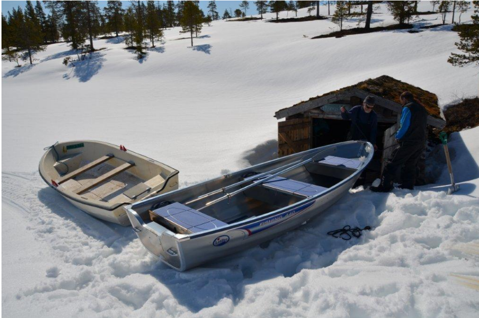
Bytte til ny båt i Stor-Øydingen

På den administrative siden ser vi at arbeidet med å organisere småviltjakt og elgjakt på en best mulig måte for allmennheten krever mye arbeid. Mange vil til Snåsafjella på jakt, og søknadsmassen på jaktkort er mye større enn det antall jaktkort fjellstyret kan tilby. Det er også viktig å holde informasjons- og salgsider på internett oppdaterte.