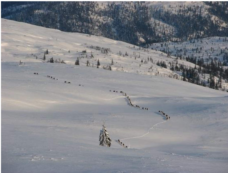
Rein på rolig vandring i Andorfjellet

Sum antall undersøkte kadavre stemmer ikke med fordelingen, da et stort antall kadavre er så gamle at det ikke er mulig å anslå dødsårsak. Det reelle tapstallet er også høyere enn det som blir funnet og registrert.