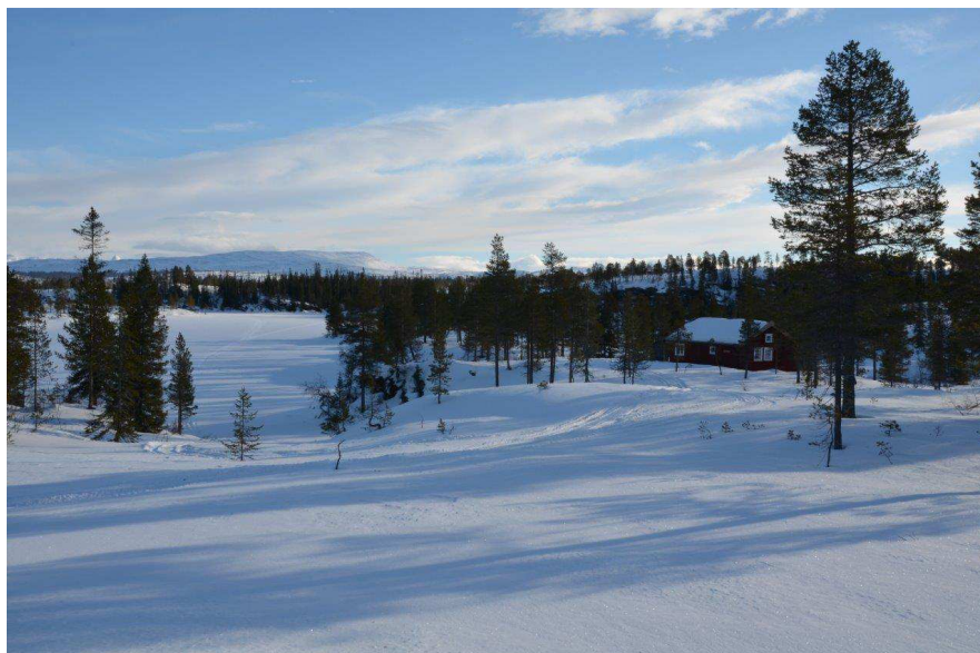
Andorsjøhytta ble oppsatt i 2013.

I 2013 ble det oppsatt ei ny fjellstyrehytte ved Andorsjøen. Hytta var klar til utleie fom juli 2013.