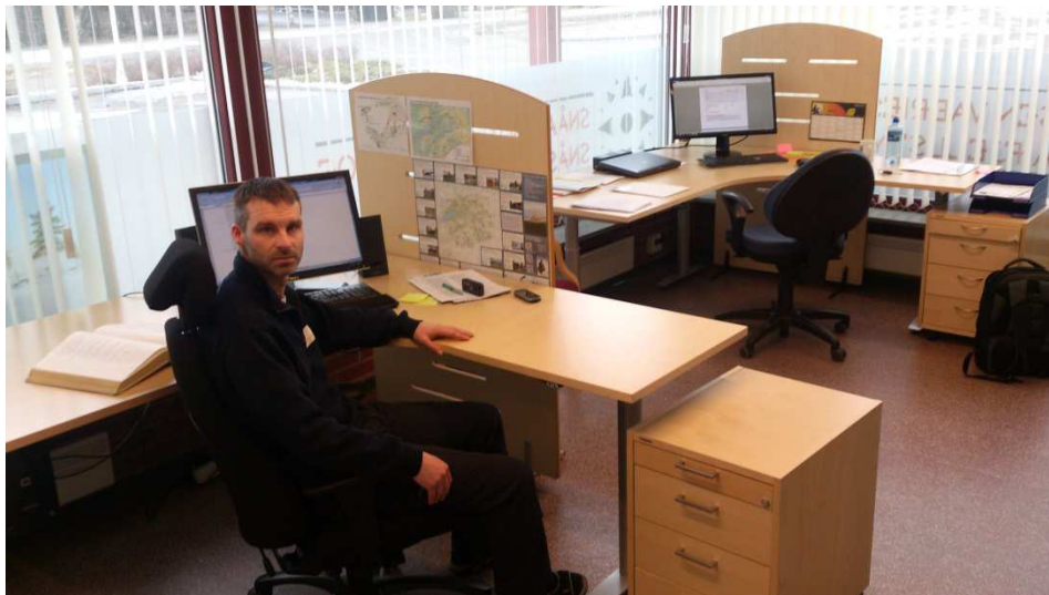
Fjellstyret flyttet inn i nye lokaler i NTE bygget i Snåsa sentrum.

I 2013 ble det skrevet avtale med NTE om leie av kontorlokaler og lager/garasje i NTE-bygget i Snåsa sentrum, og i løpet av våren ble fjellstyrekontoret flyttet inn i nyoppussede lokaler der. I NTE- bygget har fjellstyret kontorfellesskap med bl.a. Allskog. Snåsa fjellstyre byttet også logo til den standardiserte fjellstyrelogoen, og fikk med flyttingen også mye mer synlig profilering enn tidligere.