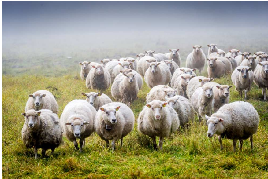
Nesten 4 500 sau og lam slippes på utmarksbeite i Snåsa.

Sau slippes fortrinnsvis i beitelag, men også som enkeltbesetninger med beiteavtale på statsallmenning. Aktive beitelag for sau som beiter helt eller delvis i statsallmenningene er Skjækra-, Raudbeinsetra-, Murbrekfjellet- og Snåsa beitelag.