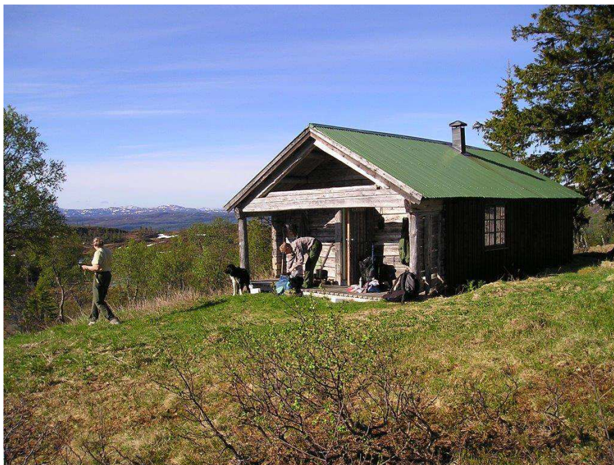
Merralihytta er utvist som gjeterhytte til Raudbeinsetra saubeitlag

Etter å ha hatt møte med beitelagene bestemte fjellstyret at Åsvasseteren og Merralihytta skulle videreføres som rene gjeterhus, uten mulighet for utleie. Begrunnelsen for det var at fjellstyret ønsket likebehandling i forhold til andre gjeterhus på Snåsa, og at man unngår gråsoner i forhold til bruken og retten til avgiftsfritt feste (gjeterhus i medhold av seterforskriften er avgiftsfritt, mens utleiehus er avgiftsbelagt). For at det i framtida bør være rimelig kurant å få sette opp enkle gjeterhus i allmenningen når det er behov for det, er det også viktig at slike hus brukes kun til det det er tenkt til og som er bakgrunn for tillatelsen.