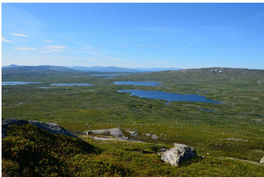
Nærmere 400 km 2 i grenseområdene mellom Snåsa og Lierne er praktisk talt uten jaktpåvirkning.