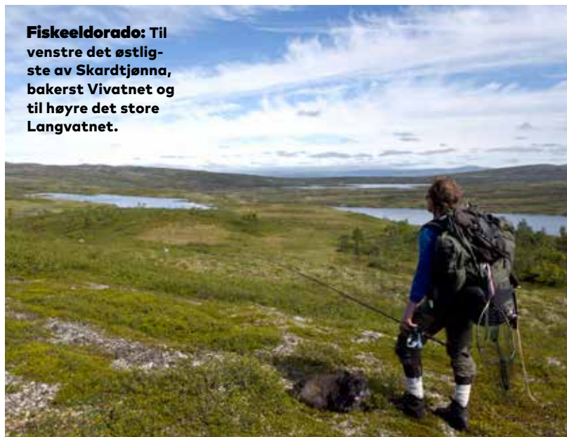
Fiskeeldorado: Til venstre det østligste av Skardtjønna, bakerst Vivatnet og til høyre det store Langvatnet.